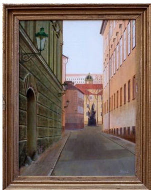
Maltézské náměstí; 40x30cm;