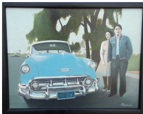
Chevrolet, olej, plátno;