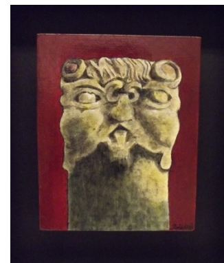
Bafomet, olej, sol.